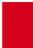
1/1 randabfallend* 170 x 240 mm Fr. 3'200.-