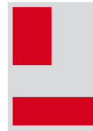
1/4 (hoch) 72 x 108 mm 1/4 (quer) 150 x 52 mm Fr. 900.-