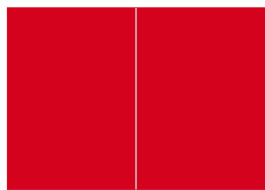
2/1 randabfallend* 340 x 240 mm Fr. 6'300.-