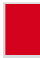
1/1 Satzspiegel 150 x 220 mm Fr. 3'200.-