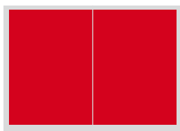
2/1 Satzspiegel 320 x 220 mm Fr. 6'300.-