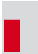
1/3 hoch 72 x 146 mm Fr. 1'200.-