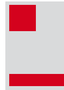
1/6 (hoch) 72 x 71 mm 1/6 (quer) 150 x 33 mm Fr. 600.-

* randabfallend = plus 3mm Beschnitt pro Seite Sämtliche Preise verstehen sich exkl. 7,6% MWSt.