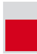
2/3 150 x 146 mm Fr. 2'500.-