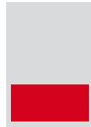
1/3 quer 150 x 71 mm Fr. 1'200.-