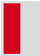
1/2 hoch 72 x 220 mm Fr. 1'700.-